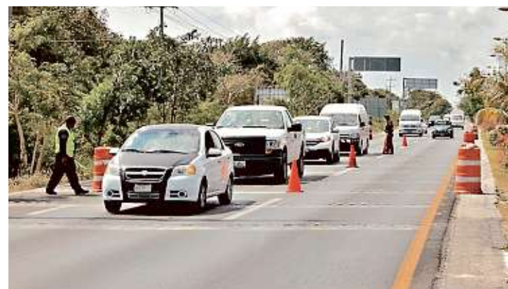
Consejeros ciudadanos del INM advierten mayor presupuesto en control migratorio con el Plan Frontera Sur.