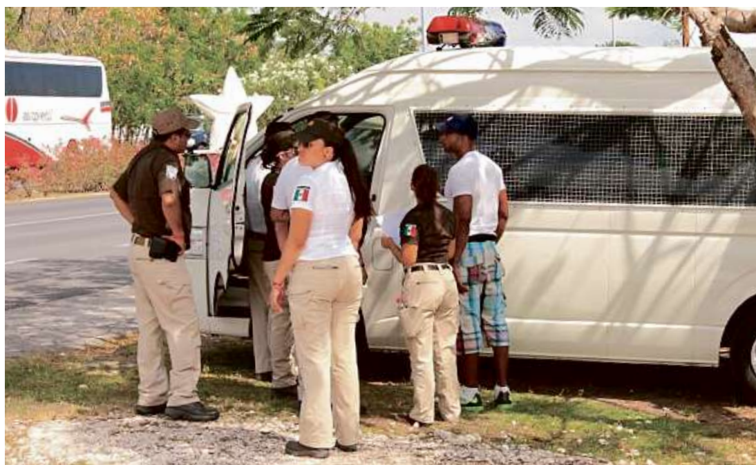
El INM detiene al mismo número de personas extranjeras en relación a los ciudadanos mexicanos repatriados que asiste en la frontera norte, según un reporte.

al PTRM, primero por la veda electoral a nivel federal y posteriormente en Chiapas, cuyas elecciones locales se celebraron el 19 de julio; y, el costo por recibir la condición de residente temporal, que oscila cerca de los 9 mil pesos”, refiere.