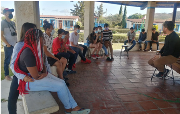
IDC y socios interactuando con niños que tienen experiencia vivida en migración y detención en México

Además, IDC colaboró con IMUMI y SOS Children's Villages en México y Centroamérica para facilitar el diálogo con niños, niñas y adolescentes con experiencia vivida en migración y detención, con el propósito de promover su liderazgo y desarrollar herramientas para la incidencia. IDC brindó asesoría técnica en evaluaciones y metodologías éticas y participativas.