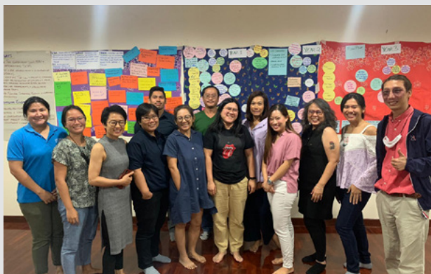
Taller de Teoría del Cambio con socios de IDC en Tailandia, septiembre 2020

IDC desea agradecer a nuestra membresía y socias de todo el mundo por su continuo apoyo durante este año. Un agradecimiento especial a los miembros del Comité Asesor Internacional de IDC y al Comité de IDC que brindan su tiempo con tanta generosidad y nos permiten hacer que nuestros esfuerzos de colaboración sean efectivos y de alcance global. Además, muchos de nuestros socios no forman parte de los comités formales de miembros de IDC; sin embargo, su generosidad y compromiso con la colaboración permiten que la red de IDC logre mucho más de lo que cualquier organización por sí misma podría lograr. Gracias a todos por su visión, energía y voluntad para compartir su conocimiento.