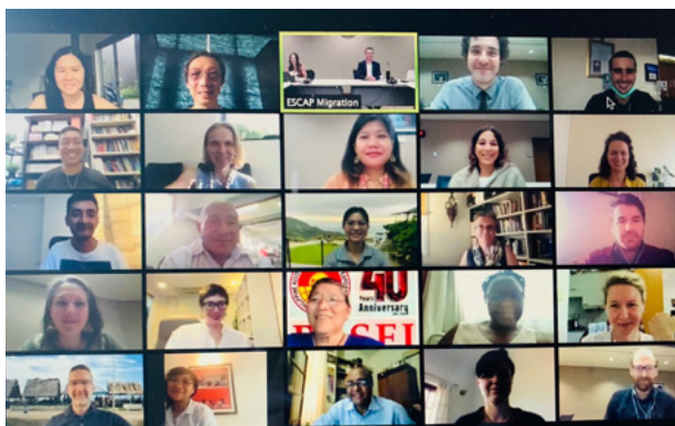
Personal de IDC codirigió las discusiones en las consultas de las partes interesadas de Asia Pacífico para el GCM, noviembre de 2020

Desde sus inicios, IDC ha priorizado el desarrollo de comunidades de práctica. Estos procesos de aprendizaje entre pares facilitan el intercambio de ideas, experiencias, conocimientos y desafíos, además de fomentar el apoyo continuo entre las partes interesadas. Al promover nuestro enfoque centrado en soluciones, IDC facilitó intercambios clave de aprendizaje entre pares para los miembros y socios de IDC a nivel interregional y mundial este año.