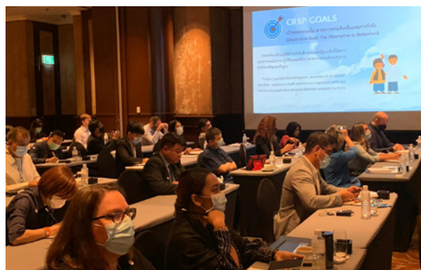
Reunión General Anual de la CRSP, diciembre de 2020

para poner fin a la detención migratoria de niños, niñas y adolescentes y limitar la detención de otros grupos vulnerables. Esta estrategia de 3 años se adoptó en la Reunión General Anual de la CRSP en diciembre de 2020, a la que asistieron más de 80 participantes de una diversa gama de partes interesadas, incluidas agencias gubernamentales, ONG internacionales, agencias de la ONU y misiones diplomáticas, en particular la Embajada de Canadá en Tailandia que ha aumentado su apoyo a estas iniciativas en el último periodo.