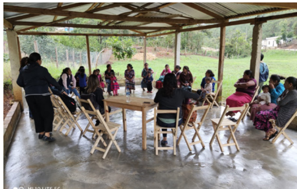
IDC y sus socios involucran a las comunidades fronterizas apátridas en México

Continuamos comprometidos con brindar a nuestra membresía el apoyo, los recursos y la experiencia técnica que necesitan para impulsar la incidencia para poner fin a la detención migratoria. Conozca a nuestra membresía aquí , y hazte parte aquí .